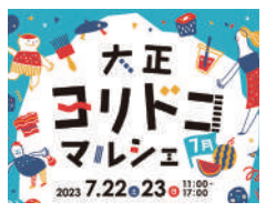
ヨリドコマルシェ