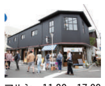
マルシェ 11:00~17:00 (建物の見学は10:00~)

築70年の長屋をリノベーションした「アート×福祉×小商いの拠点」の空きテナント物件。7月22日・23日は泉尾神社の夏祭りとのコラボで「ヨリドコマルシェ」を開催!あれこれ楽しい企画が盛りだくさん、ぜひ遊びに来てください!